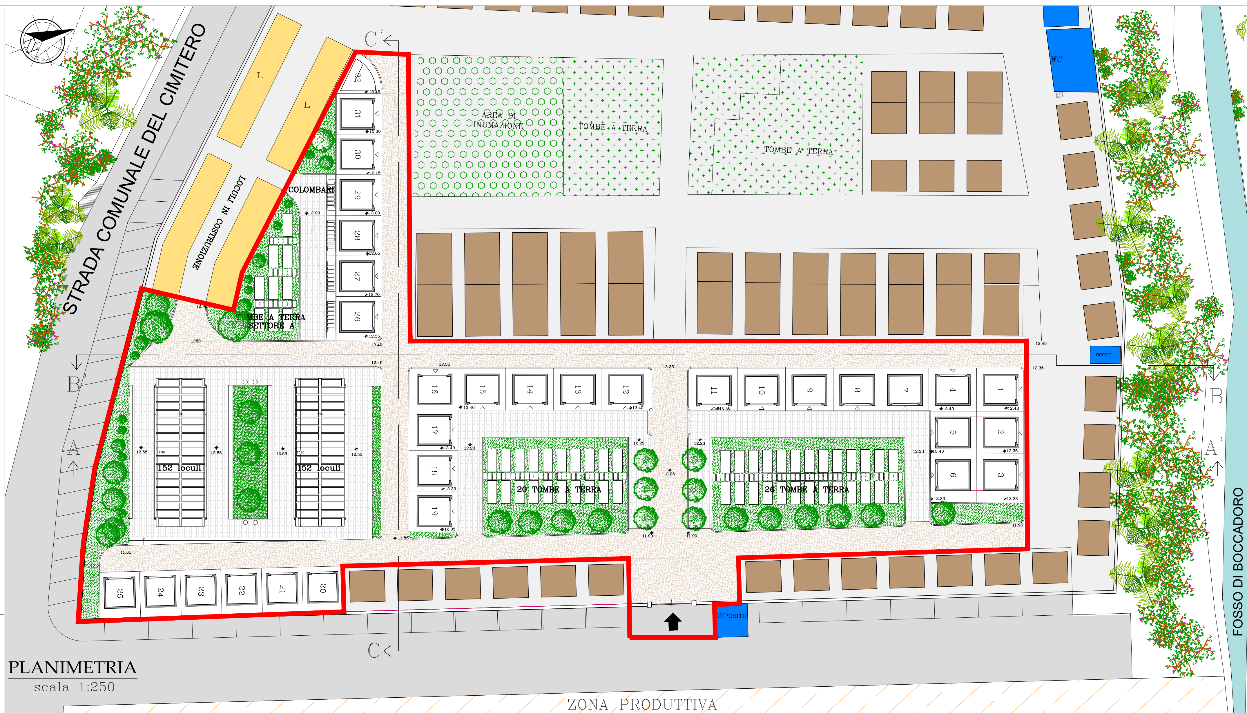
PLANIMETRIA scala 1:250