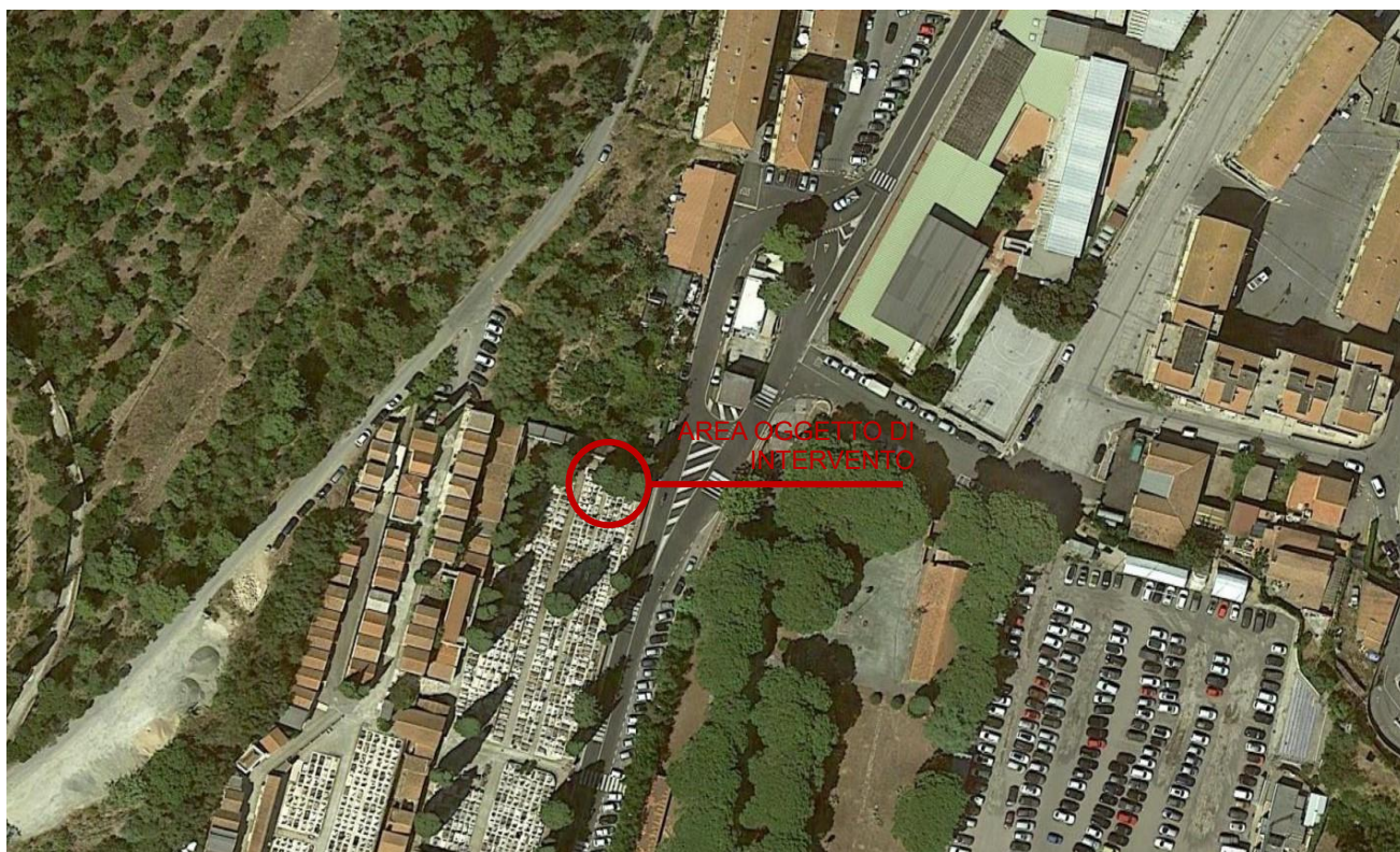
Foto aerea di dettaglio