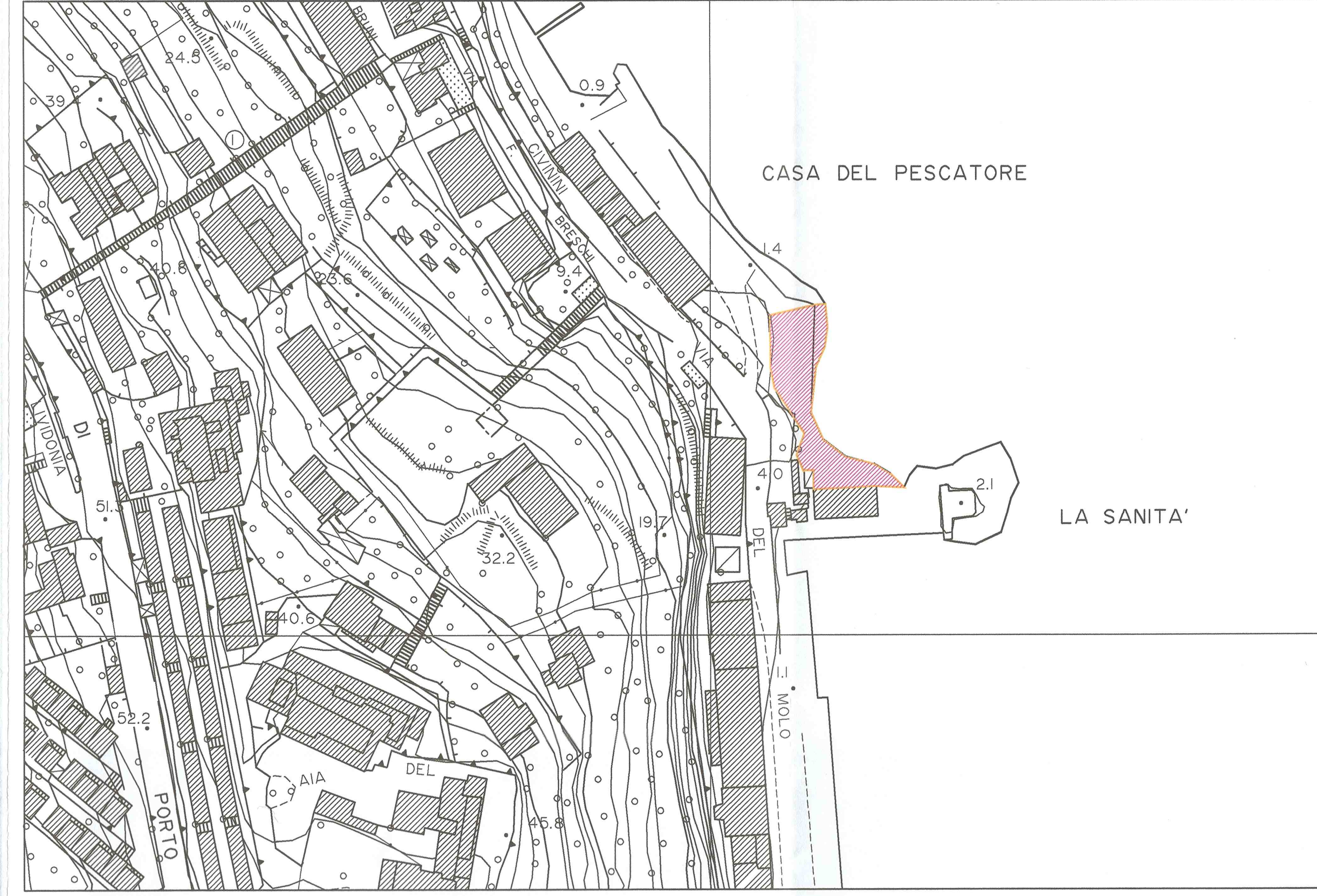
Spiaggia 9 - La Sanita'