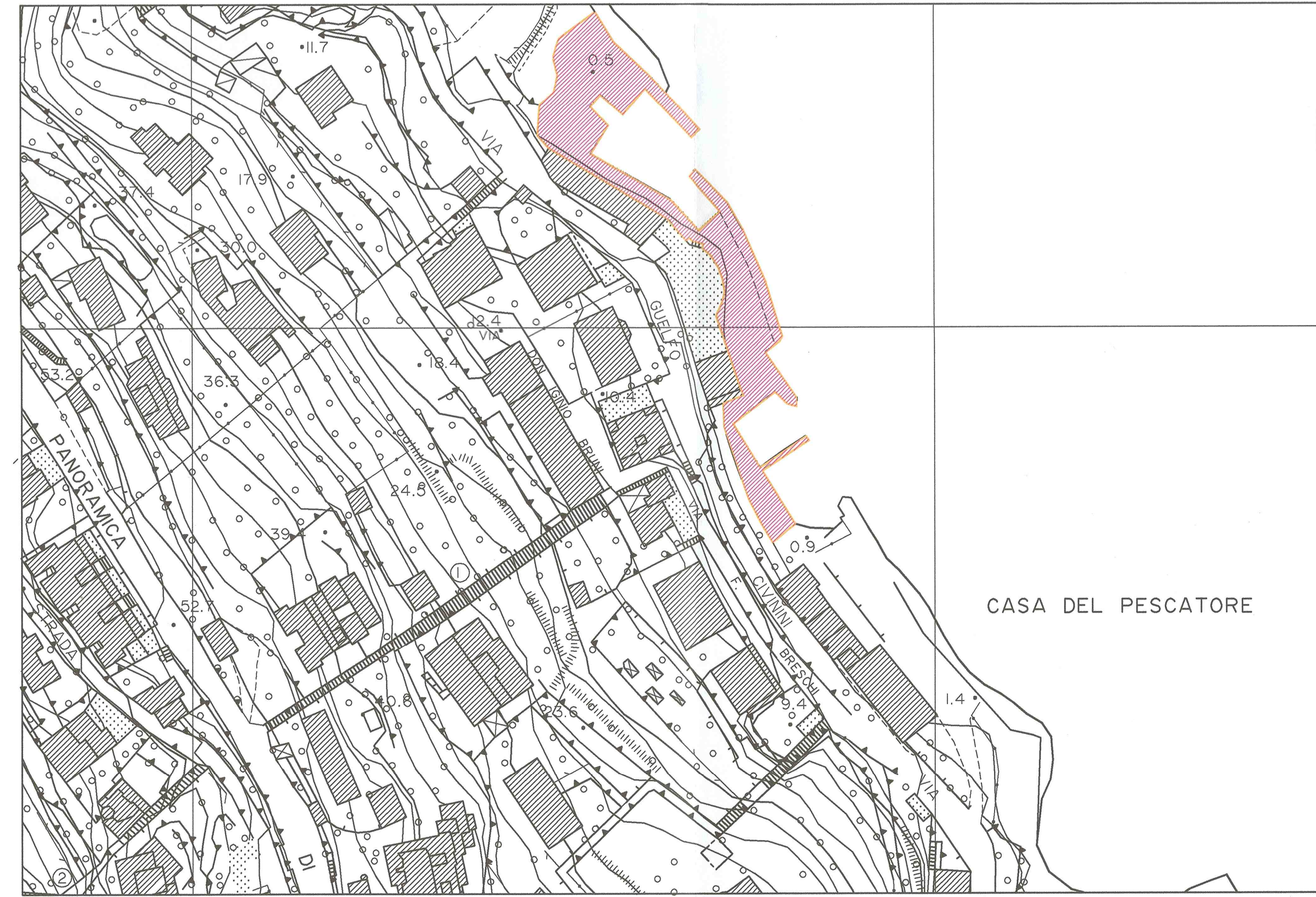
Spiaggia 10 - La Caletta