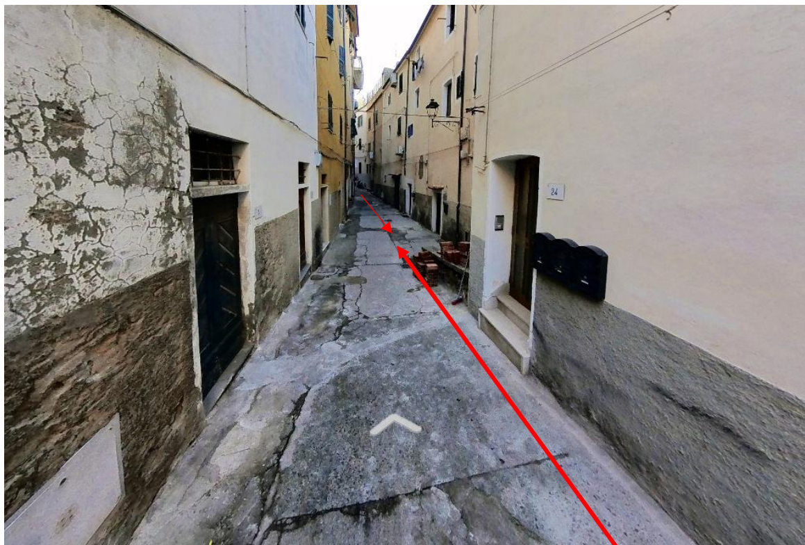
Figura 3. Foto 2