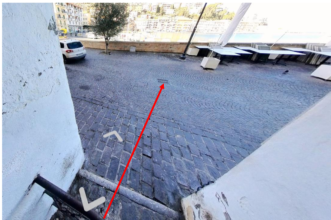
Figura 12. Foto 11