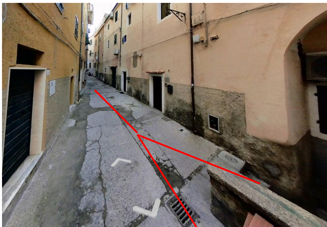
Figura 4. Foto 3