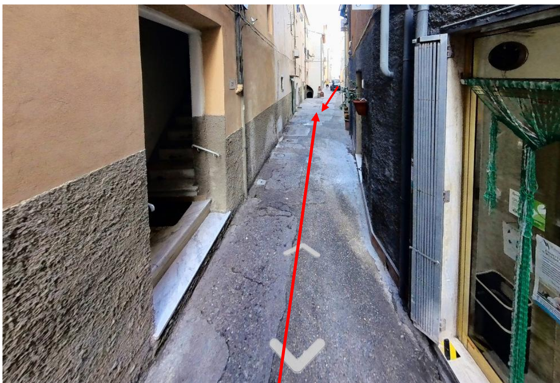
Figura 8. Foto 7