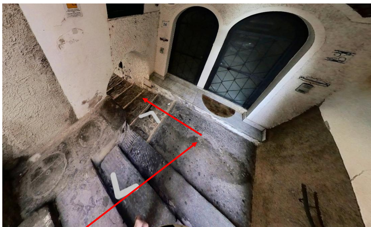
Figura 10. Foto 9