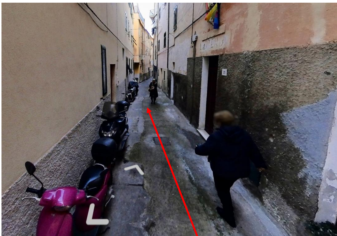
Figura 6. Foto 5