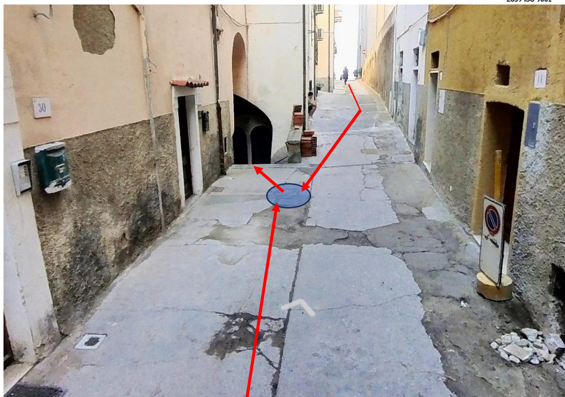
Figura 9. Foto 8