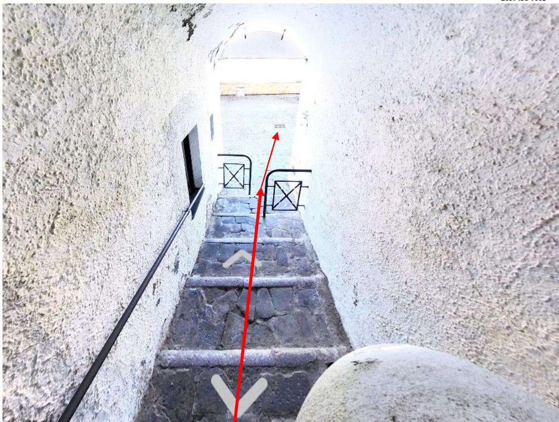
Figura 11. Foto 10