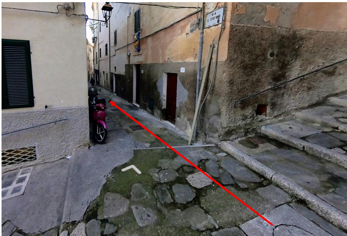
Figura 5. Foto 4